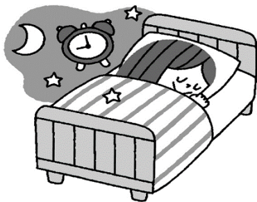
規則正しい生活で体調を整える