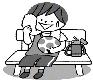
運動するときはこまめに休憩をとる