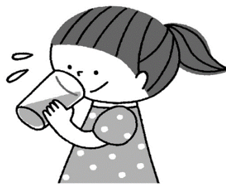
喉が渴く前にこまめに水分をとる